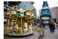
台北法國百年市集攻略地圖大公開