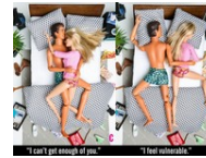
芭比、肯尼揭開11種情侶睡姿秘密