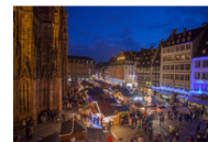
400年歐洲耶誕市集現身台北101