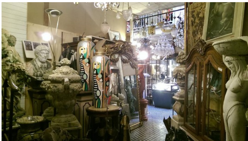
▲ 藝術家劉辰岫於比利時駐村期間，覺察當地人對對於舊物的喜愛及文化的尊重。